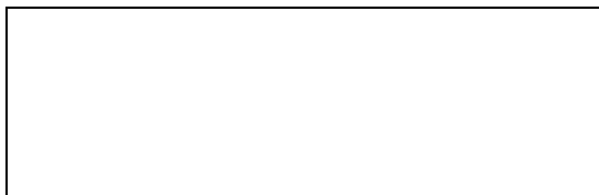
Схема границы балансовой принадлежности тепловых сетей

Прочие сведения по установлению границ раздела балансовой принадлежности тепловых сетей _____