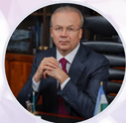
Андрей Назаров Премьер-министр Республики Башкортостан