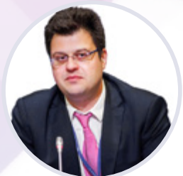
Никита Кузнецов Директор Департамента развития внутренней торговли Минпромторга России