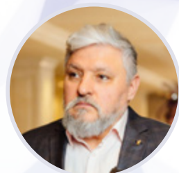
Игорь Бухаров Президент Федерации Рестораторов и Отельеров России