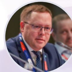
Андрей Карпов Председатель правления Российской Ассоциации экспертов рынка ритейла