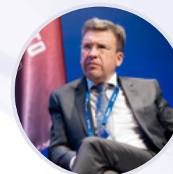
Владлен Максимов Президент Ассоциации малоформатной торговли России