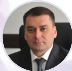
Алексей Гусев Министр торговли и услуг Республики Башкортостан